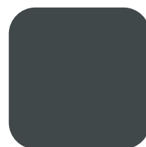
Anthracite RAL 7016