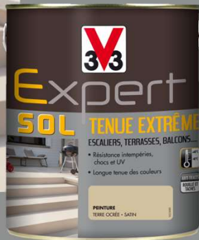
Formats : 0,5L - 2,5L - 5L