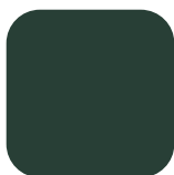
VERT OMORIKA RAL 6009