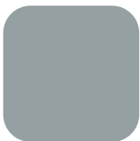
GRIS GALET RAL 7045