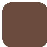
BRUN NORMAND RAL 8011