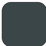
ANTHRACITE RAL 7016