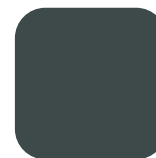
NOIR CHARBON RAL 7021