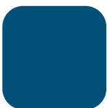
BLEU BRETAGNE RAL 5010