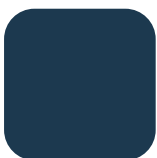
BLEU HOGGAR RAL 5003