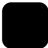
NOIR RAL 9005