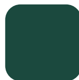
VERT BASQUE RAL 6005