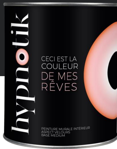
Base M Medium

Peinture velours intérieure destinée aux murs, boiseries, radiateurs et surfaces lisses., pièces sèches comme humides.