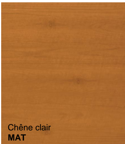
Chêne clair MAT