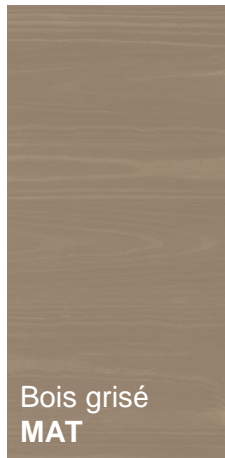
Bois grisé MAT