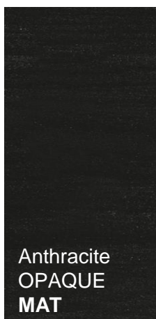
Anthracite OPAQUE MAT