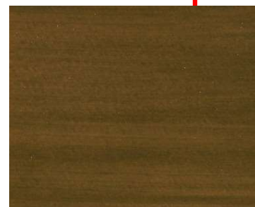
IPE DU BRÉSIL