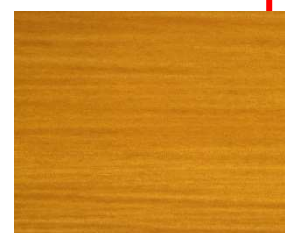
CHENE CLAIR SA-BI