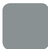
GRIS GALET RAL 7045