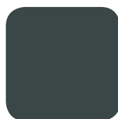
ANTHRACITE RAL 7016