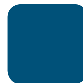
BLEU BRETAGNE RAL 5010