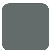
GRIS BASALTE RAL 7012