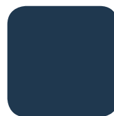
BLEU HOGGAR RAL 5003