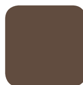
BRUN NORMAND RAL 8011