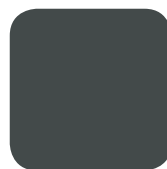
NOIR CHARBON RAL 7021