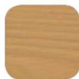
Sapin du Nord